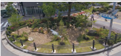
▲ 雨庭／過去の講座の様子